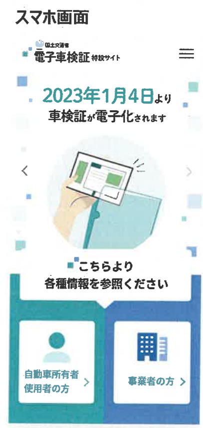
※画面の構成はPC版と同じです。